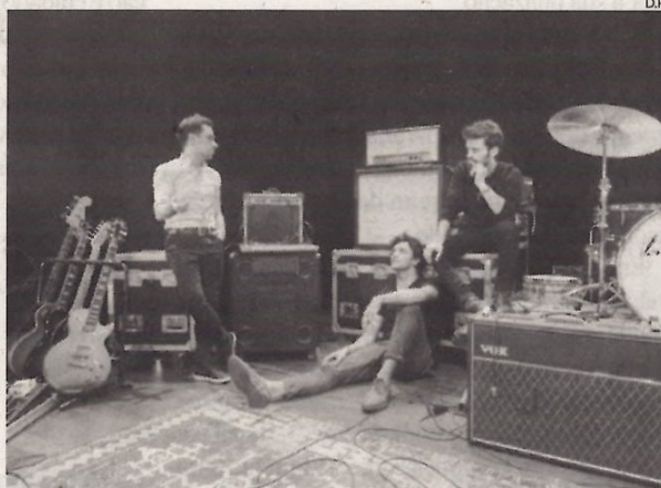
Os Prana abrem, hoje, o OuTonalidades em Estarreja

Águeda, Albergaria-a-Velha, Estarreja, Gafanha da Nazaré, Santa Maria da Feira, Sever do